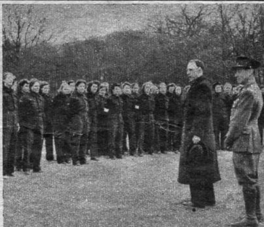
De Belgische minister bij de Luxemburgsche regering op bezoek bij de Belgische vrouwen die zich nu reeds voorbereiden op haar taak na de bevrijding, een taak van hulp en bijstand aan haar landgenooten. Les femmes belges en Angleterre s'entraînent en vue des tâches de secours et d'assistance qui les attendent à la libération de la patrie. Le Ministre de Belgique auprès du Luxembourg s'adresse à ces volontaires lors de sa visite à un de leurs camps d'entraînement.