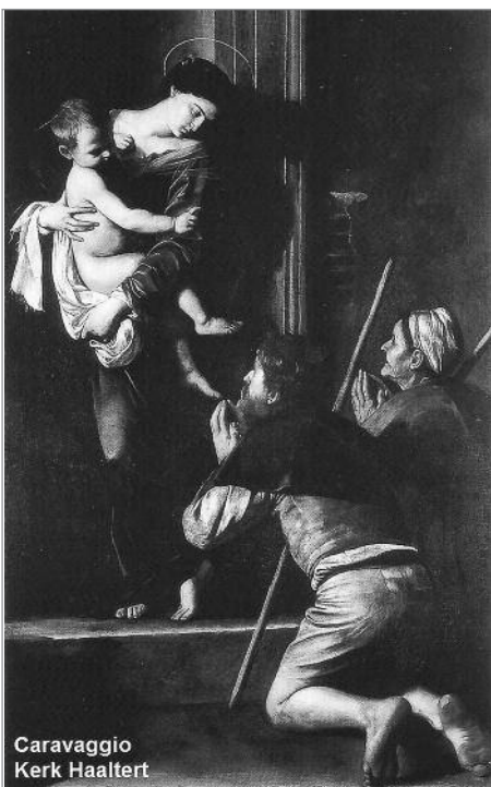
Caravaggio Kerk Haaltert

Misschien toch een tip voor kerkbezoekers: loop vooraan naar de altaren en bewonder even deze 'kerkschaten'.