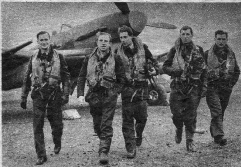
Belgische jachtpiloten keeren na een vlucht terug op een vliegplein ergens in Engeland. De geallieerde luchtmacht is trotsch op Uwe landgenooten en zij zult op hen niet minder trotsch zijn! Cinq pilotes de la glorieuse phalange des chasseurs belges d'Angleterre rentrent au terrain après avoir accompli une mission. Les pilotes belges constituent un corps d'élite de l'aviation des Nations Unies.